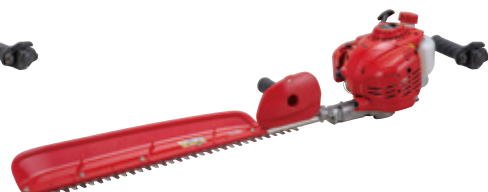
高耐久ブレード仕様 HT2211S-750HB [710mm] 希望小売価格(税込) ¥82,500