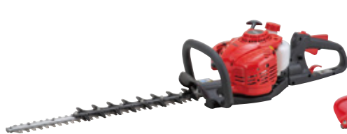
DH2211S-600T [580mm] 希望小売価格(税込) ¥74,580