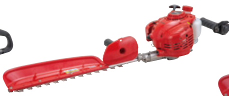
HT2211S-600B [580mm] 希望小売価格(税込) ¥78,650